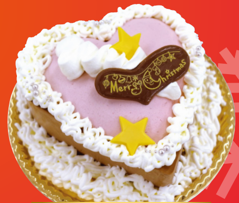
Xmasストロベリーショコラ

“ふわっ”ととろける食感の看板商品。京都とろけるチーズケーキのクリスマスケーキ。