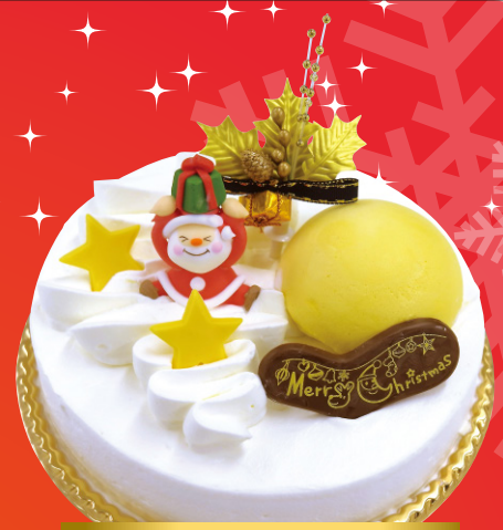
とろける Merry Xmas