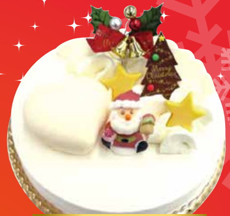
とろける Merry Xmas